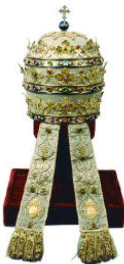
Tiare du pape Pie IX (1846- 1878). Don de la Garde Palatine au pape, 1877. Le pape Jean XXIII (1958 – 1963) est couronné avec cette tiare en 1958.

Une centaine d'objets magnifiques provenant du Vatican pourront être admirés. Ces objets, qui n'ont jusqu'à présent jamais été accessibles au public, seront présentés pour la première fois en dehors du Vatican. Parmi ceux-ci, on pourra y admirer la tiare papale (le Trirègne) avec laquelle Jean XXIII a été couronné, la bague de Pie XII et d'autres bijoux tels que mitres, reliures, calices et reliquaires. Tous ces objets précieux, pour la plupart richement décorés d'argent, d'or et de pierres précieuses, ont été façonnés pour onze papes au cours des deux siècles derniers.